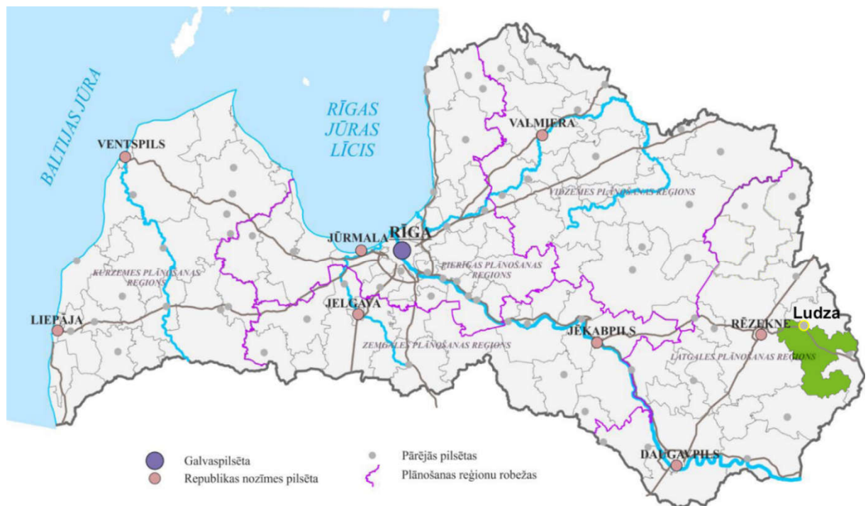
1.1.att. Ludzas novada ģeogrāfiskais novietojums

Novada administratīvais centrs ir Ludzas pilsēta. Tā atrodas 267 km attālumā no valsts galvaspilsētas Rīgas, 122 km attālumā no Daugavpils un 30 km attālumā no Rēzeknes (skat.1.1.att.). Ludzas novads robežojas ar Ciblas novadu, Zilupes novadu, Rēzeknes novadu un Dagdas novadu. Robeža ar Krievijas federāciju (14,7 km gara robeža) ir arī valsts robeža. Ludzas novada administratīvajā teritorijā ietilpst Ludzas pilsēta un 9 pagasti – Briģu, Cirmas, Isnaudas, Istras, Nirzas, Ņukšu, Pildas, Pureņu un Rundēnu.